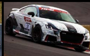
2021 KANTO Champion Urano TTRS

2022年もVWA-Trialに加えレースクラス「VWA-Cup」を開催！レースの楽しさを是非味わって下さい！筑波サーキットでの開幕戦より各地区で開催します！