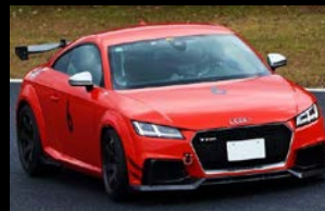
2021 KANSAI Champion Takahashi TTRS