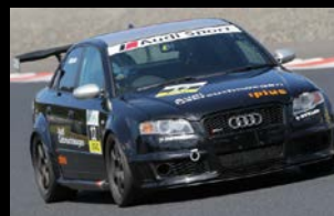
2020 KANSAI Champion Yamamoto RS4