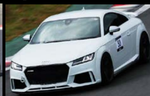
2020 KANTO Champion Urano TTRS

2021年もVWA-Trialに加えレースクラス「VWA-Cup」を開催！レースの楽しさを是非味わって下さい！筑波サーキットでの開幕戦より各地区で開催します！